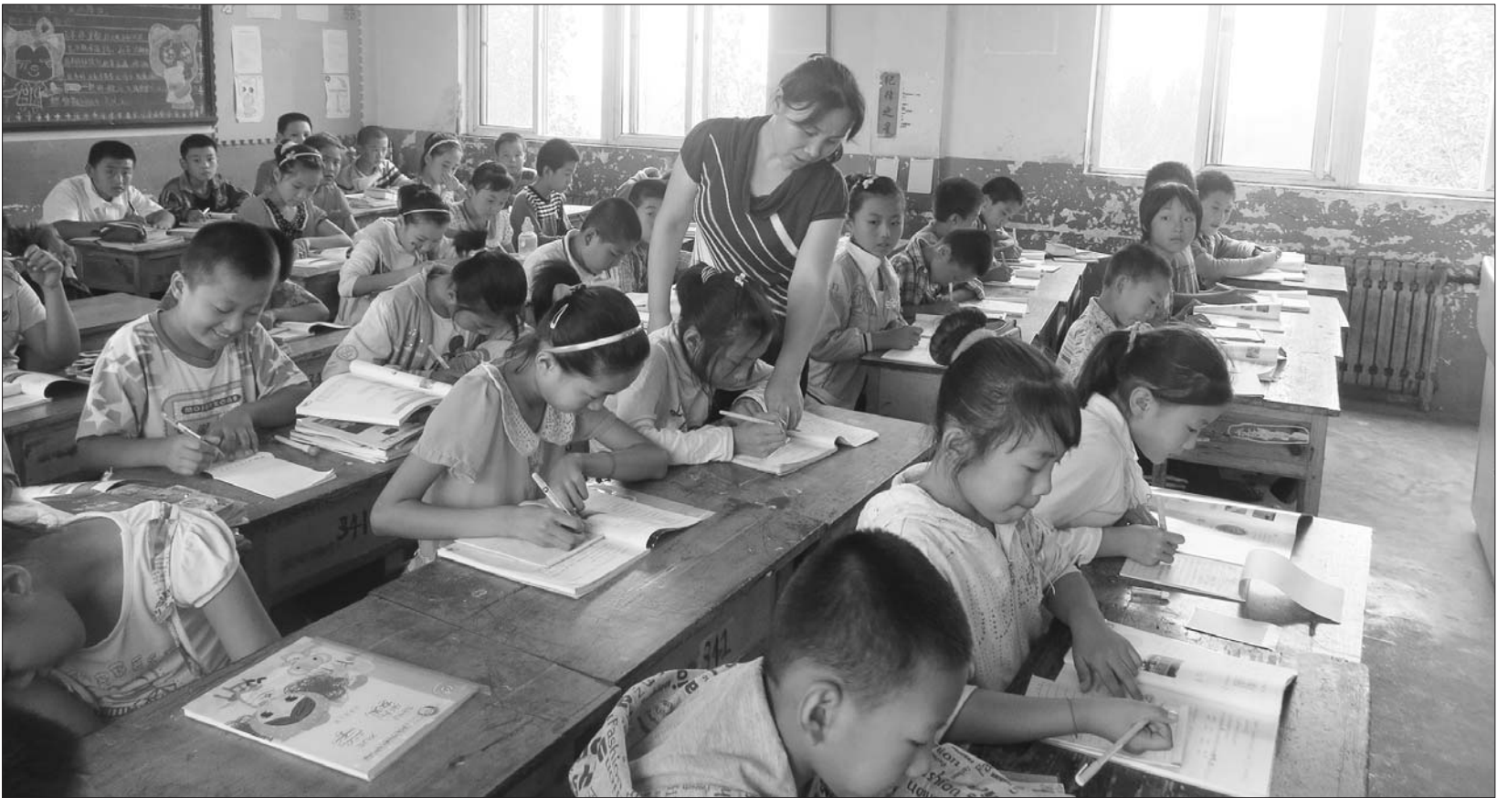
来自城里的支教老师正在给双峰联小的学生上课。

不可否认,城乡的差距,让教育资源一直往城市聚集,农村学校留不住老师,硬件设施难以得到有力保障,无形中拉大了城乡教育的失衡局面。借教师节之际,本报关注农村师资流失现象,直面这一待解难题。