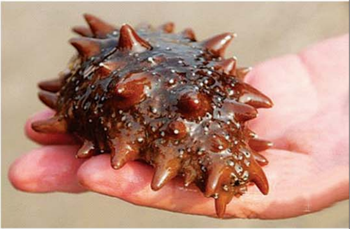
本次“海参直销惠”将展售大连原产地 天雄 六排刺刺参，外形圆润、饱满，是海参中的极品。

本次活动时间定在本周六、周日（9 月 14 日 - 9 月 15 日）两天，地点在枣庄电视台一楼（华山路与光明路交叉口往西一百米）详情可拨打本报热线 15006322572 咨询。据了解，由于本次活动价格太实惠，很多消费者早已按耐不住，就等到时来枣庄电视台一楼“抢”海参。