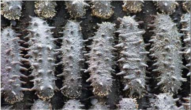
图为参加本次展销的 天雄品牌的优质淡干刺参

去除海参价格泡沫，是良心工程，也是双赢工程。海参价格早日回归真实，让消费者得到实惠，也会推动整个海参行业良性健康发展。本报举办首届“海参直销惠”，价格太实惠，预计将掀起抢购潮。