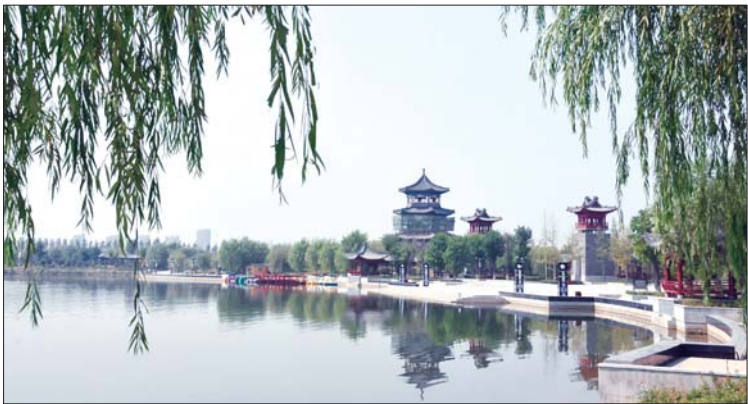
蓼河仿古文化商业街项目显雏形。