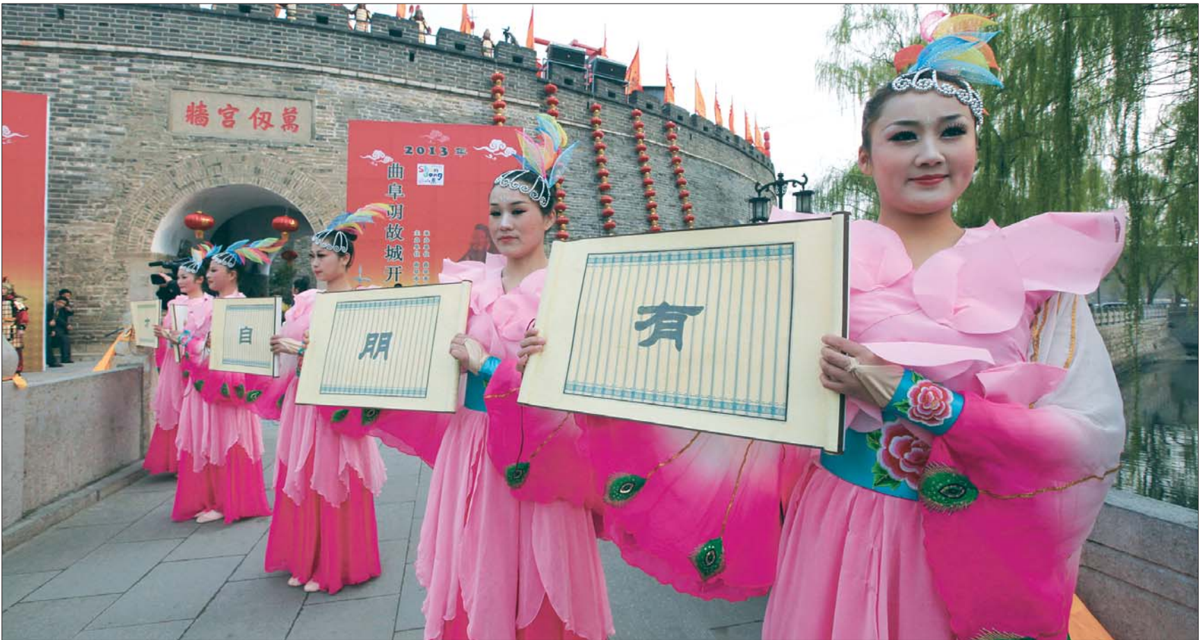
曲阜今年推出的景区常规演艺活动。本报记者 张晓科 摄