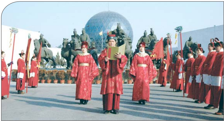
孔子六艺城推出的开城迎宾礼。