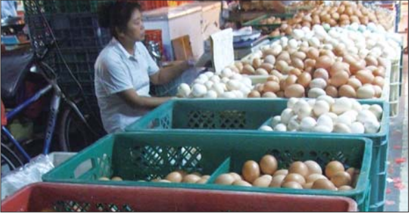
三环市场的鸡蛋摊位。(资料图)

“4块3算是比较正常的价格，应该不会再大幅下跌了，周末‘十一’临近，还有可能会小幅回升。”经销商李先生说。