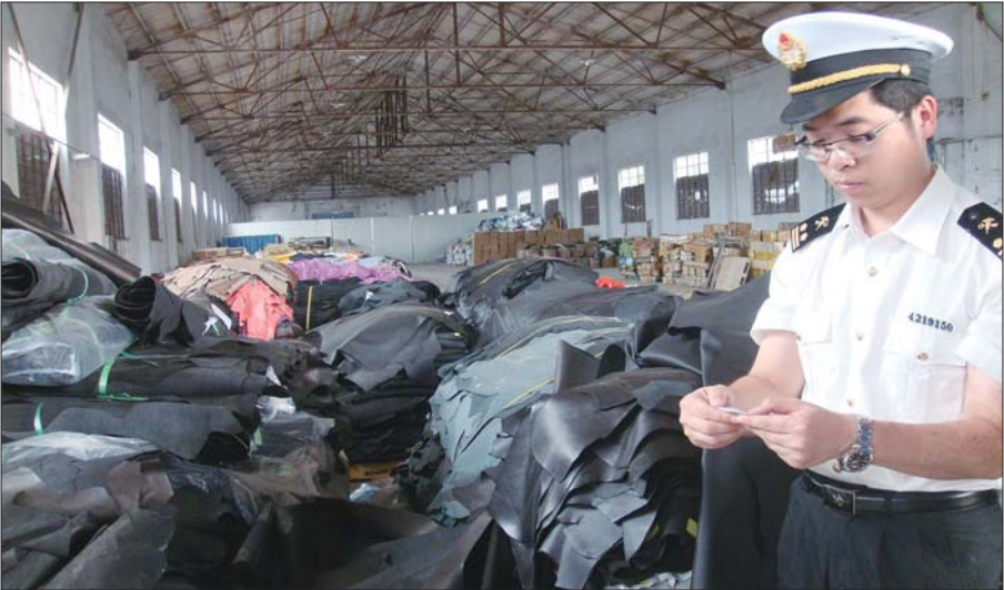
海关监管仓库里堆满了查获的牛皮草，工作人员正在查看上面的标签。

“查验关员进入集装箱发现，里面夹藏着的旧皮衣和整张牛皮草。旧皮衣属于国家禁止进口固体废物，属于洋垃圾的一种。”路天鹏说，整张的牛皮草比非整张牛皮草价格高很多，牵涉到海关的完税价格