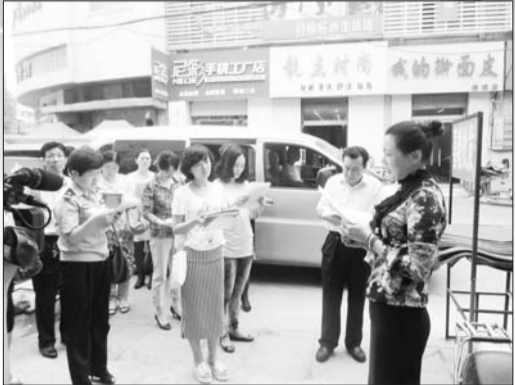
区各部门领导到我街道中心社区调研城区管理工作

作环境,强化领导保障。街道党委理论学习中心组每年将人口理论、计划生育法规等作为重要内容列入学习计划,统一思想认识,提升创优工作热情;街道党委、办事处将开展优质服务作为“一把手”工程,成立由党委书记任组长的工作领导小组,对优质服务创建工作进行全面安