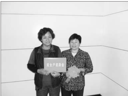
为双女绝育家庭发放奖励金