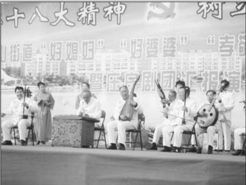
广场文艺演出