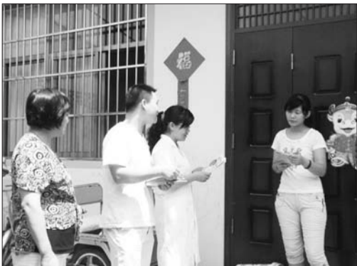
优质服务进居入户