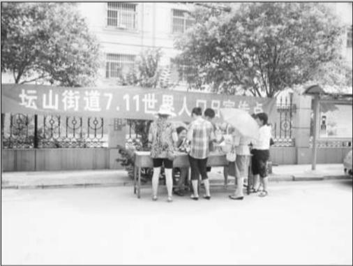
设置宣传点为育龄群众发放宣传品

体系,逐步提高育龄群众的优生意识,出生缺陷发生率得到有效控制。二是拓宽服务领域,满足育龄群众生殖健康需求。充分利用计划生育流动服务车,组织技术骨干,定期携带常用仪器和药品到辖区内各社居为广大育龄群众送服务、送健康。四是深化药具管理体制改革,满足群众避孕药具需求,逐步建立完善“属地管理、单位负责、居民自治、社区服务”管理体制,实现了全街道药具管理工作规范化、制度化、信息化。目前全街道共设置避孕药具免费发放点12个,极大地方便了育龄群众。 (田家涛 李茂勇 邱运鹏)