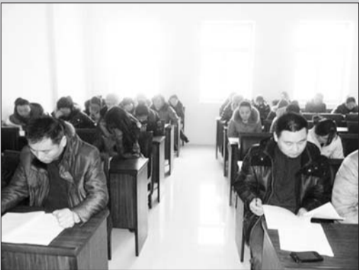
街道、社居计生工作人员培训会