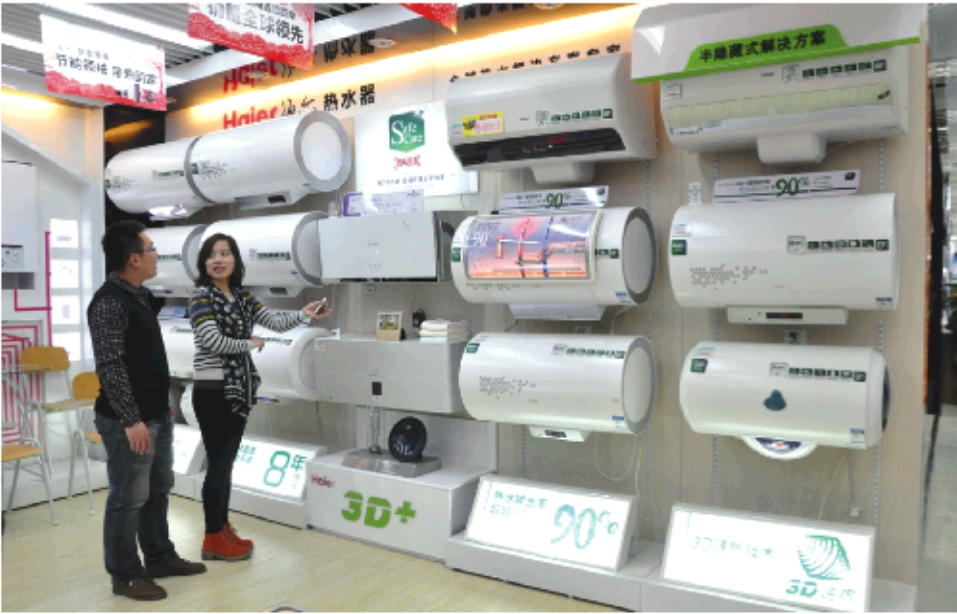
消费者在家电卖场选购海尔电热水器。

2008年,防电墙在成为国家标准后,又顺利通过国家电工委员会大会一系列的严格测试,被正式写入《家用和类似用途电器的安全储水式电热水器的特殊要求》的最新版本中。