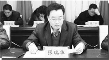
党委副书记作计划生育工作总结

为深入开展计生助福行动，积极推进了幸福家庭创建，阴平镇对今年参加高考的一孩户、双女户家庭开展金秋助学活动，启动生育关怀基金，对今年考入本科的计生困难家庭学生发放助学金2000元，考入专科的计生困难家庭学生发放助学金1000元。为确保该活动扎实有效，高考成绩公布后，该镇立即成立金秋助学领导小组，对全镇参加高考的计生困难家庭进行摸底调查，建立档案，摸清学生考试情况、家庭经济情况、家庭困难情况，向他们发放金秋助学宣传单，在各大院校录取后，由计生困难家庭学生提交救助申请，经过村级初审、逐人审核、张榜公示、统一发放，实现了阳光操作，接受群众监督，真正让广大计划生育家庭在经济上得实惠、政治上有地位、生活上有保障、精神上受鼓舞，让计划生育困难家庭切实感受到党和政府的温暖，提高计生家庭的荣誉感。计生助福行动的开展转变了群众的传统婚育观念，提高广大群众依法实行计划生育的积极性和自觉性。