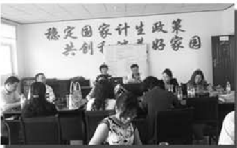
区计生局来阴平调研