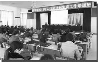
计划生育工作培训班