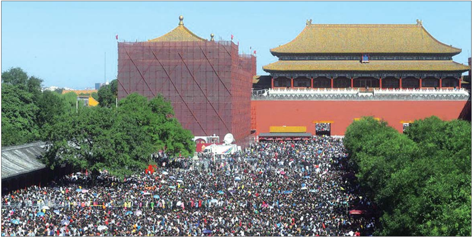
黄金周期间,故宫人满为患。