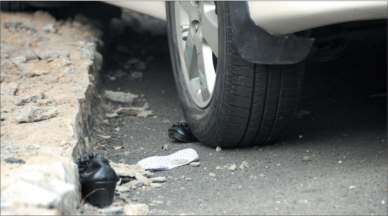
8日,鲁大校园里撞伤学生的肇事车轮胎下,还压着一位学生的鞋子。

本报10月8日讯(记者苑菲菲) 8日上午11点半左右,鲁东大学校园内发生一起车祸。3名女研究生买饭回宿舍途中,被一辆轿车撞伤,其中两名女学生跌进近四米深的楼底夹道中,造成头部、颈部多处创伤,另一名学生左小腿骨折。