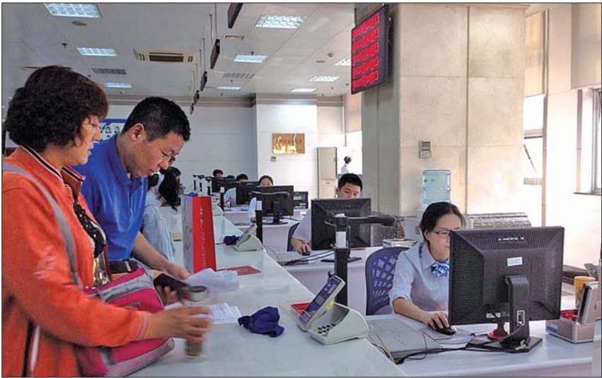
9日,前来房产交易大厅的市民络绎不绝。

该负责人表示,虽然今年1-9月份二手房成交同比大涨,但与其他省会城市比如郑州等相比,济南二手房的成交总量仍不算高,未来市场仍有较大空间。