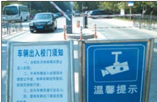
烟大门口设置起降杆限制外来车辆进入校园。