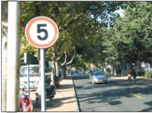
鲁东大学西门竖着限速标志。