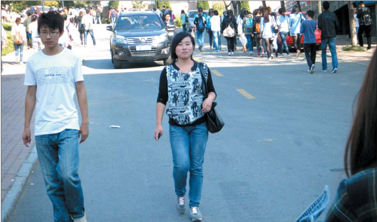
9日下午2点,在鲁大校园内,上课的学生流与汽车走在一起。

鲁东大学宣传部称,目前受伤学生所在学院的主要领导都守在医院,2名受伤较重的学生情况已基本稳定。对于受伤学生的伤势情况,学校也会及时跟交警部门进行通报。