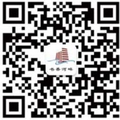
▲长信书香河畔官方微信

如果在书香河畔买房,不仅居住方便,孩子上学也方便。”记者看到,许多客户都是抱着孩子过来的,精致细致的售楼处内,更增添了许多生气。 “现在客户还是挺多的,因为紧挨着正在建设的高科园小学,所以咨询学校问题的客户也特别多。客户都想买一套学区房,孩子上下学方便了,家长也免去上下班接送,一举多得。”山东长信集团的一名工作人员说。