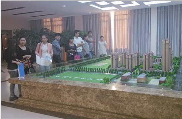
9 日下午,不少市民在长信书香河畔售楼处看房。