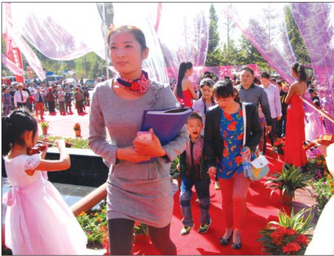
购房者分批进入恒基·都市森林样板体验区。

除了泰山国际金融中心公开宣布10月19日开盘外,其他几个楼盘的确切日期都只说10月份。“黄金周期间不适合开盘,因为可能有部分客户会选择外出旅游,会影响成交情况,同时也是对这部分购房者不公平。”一位业内人士向记者透露,他们楼盘在开盘日期上已经调整了好几次,一般开盘日期都定在周六或周日,而黄金周之后仅剩3个周末,开盘日期“撞车”的几率非常大。“开盘是房地产项目最重要的日子,尽管很多项目都经历了一个长期的蓄客过程,开盘当天的成交量并不会受外界因素的影响,但是宣传造势上却会被其他开盘项目分走不少注意力。我们项目平时做广告宣传,都尽量避免扎堆,开盘的时候当然不希望和其他楼盘撞车。”