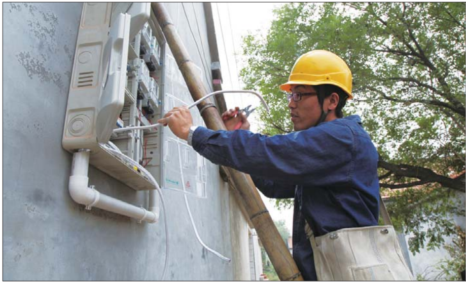
抢抓晴好天气 推进农网改造 国庆期间,惠民县供电公司一线员工为抢抓晴好天气,圆满完成农网改造升级任务,主动放弃与家人团聚时间,加班加点,力求安全、有序、高效地推进农网工程建设。

本报10月9日讯(通讯员 董士达 记者 王文彬 王娟) 为推动各项工作上台阶,锻造一支适应示范镇建设的干部队伍,李庄镇7日召开动员大会,安排部署全镇干部作风集中整治活动。 据悉,这次集中整治活动目标是推动干部作风进一步好转,机关效能进一步提升,发展环境进一步优化,为全镇又好又快发展提供强劲的动力支撑。 整治活动的主要任务是解决纪律涣散、责任心不强、工作不实、履职不到位等四方面的问题。全镇将通过学文件、学制度、学政策、征求意见、自我批评等形式查摆问题、找准根源,结合全镇中心工作和部门职责制定整改措施,以工作绩效和群众评价考察活动的效果,在此基础上完善责任追究、服务公示、工作调度、述职评议等制度,健全作风建设长效机制,引导全镇干部在推进科学发展、服务农民群众上实现新的突破。 惠民联社 >> 亮出“六个实招” 狠抓效能建设 惠民县农村信用合作联社为深入贯彻落实科学发展观,始终坚持把效能建设与中心工作同部署、同推进、同督促,亮出“六个实招”,狠抓作风效能提升,提高执行力和落实力,改善管理水平和服务水平,提升社会公众的满意度,逐步形成行为规范、职责明确、运转协调、服务优良、廉洁高效的管理运行机制。 “量化”职责。按照业务分工、岗位制约的要求,对照上级有关规定,根据各岗位工作的性质,由联社负责部门、部门负责岗位,细化各部门、各岗位的岗位职责,人手一册。并对照各岗位职责,制定考核办法,“量化”职责考核,定期兑现,相互监督。 “星级”考核。为调动全员工作积极性、主动性和创造性,全面推行员工星级管理的办法,即从联社班子成员至一般员工实行“五星”级,对定性、定量指标进行“双百分”计算考核,确定相同岗位员工的“星级”。按月考核,按季兑现,按年总评。通过考核,相同岗位,星级不同,收入差距明显,有力地促进了效能建设。 “从我”做起。坚持将效能建设作为“打基础、抓规范、提素质、促发展”的重要举措来抓,要求做到“从我做起,从总部做起”。对未按规定执行,违规操作,坚决给予处罚。定期“亮相”。对各项定性、定量 指标细化分解,层层落实,按月考核,按季兑现。对于季度完成好的前三名,颁发流动红旗,给予物质奖励;对于完成较差的后三名,上台“亮相”,说明原因,拿出办法,并给予经济处罚。连续两季度后三名的,自动辞职。次年初,联社考核与考评并重,定性定量“双考”,实行末位淘汰,择优起用。通过考核,“在位”的有压力,“上进”的有动力,员工队伍有活力,有效地推动了效能建设。 “十佳”上台。对年度考评“十佳”的员工,召开表彰大会,让他们披红戴花,集体上台,接受颁奖。还组织他们到名胜古迹,旅游度假,享受崇高荣誉,以此激励员工积极进取,奋发向上。 “暗访”监督。为提高服务意识,提升服务水平,除开展常规检查,通过远程监控管理,还购置了微型摄像机,不定期安排人员以“顾客”身份,采取“侧听、察看、问询”的办法,了解临柜人员的服务情况,即“侧听”办理业务时临柜人员的解答情况;“察看”临柜人员的服务效率和质量,以及营业场所的服务环境;“问询”有关信用卡、粮补业务手续、挂失事宜以及残破币兑换等。对“暗访”发现衣冠不整、言辞不当、服务态度冷淡等,给予从严处罚。通过以上举措,服务效率和质量实现了“零投诉”。 (惠民联社 周振杰 李滨)