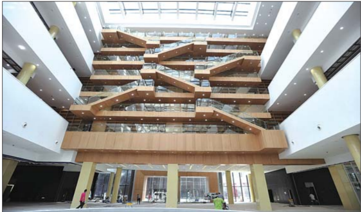
场馆内景

“十艺节”筹办期间,山东省及各市高度重视场馆设施的建设改造,重点场馆资金总投入达98.31亿元,其中承担“十艺节”演出任务的场馆有52个,直接承担文华奖比赛场馆的有28个,1200座以上的大型场馆有17个。值得注意的是,相当一部分场馆建设在市、县,这对于省、市、县、乡、村五级公共服务文化体系建设起到了有力的推动作用。