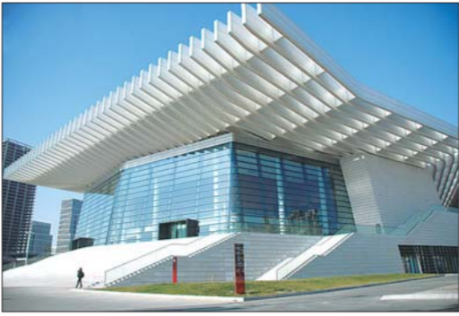
青岛大剧院

据统计,十艺节筹备期间,全省1300多个乡镇综合文化站的运行和管理得到规范提高,行政村文化大院建成数量也由5.3万个增加到5.9万多个,覆盖率达到85%。