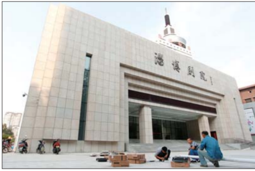
淄博剧院外景