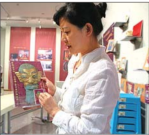
文/片 本报记者 霍晓熹

为给“十艺节”增添浓郁的文化氛围,青岛市博物馆引进了《神秘瑰丽的古蜀王国——三星堆·金沙遗址珍宝展》,并首次开发应用微信自助导览系统,观众只要添加“青岛市博物馆”官方微信,在20件重点展品的展牌上都有相应的编号,手机微信中输入编号,即可自动播放该件文物的语音导览。