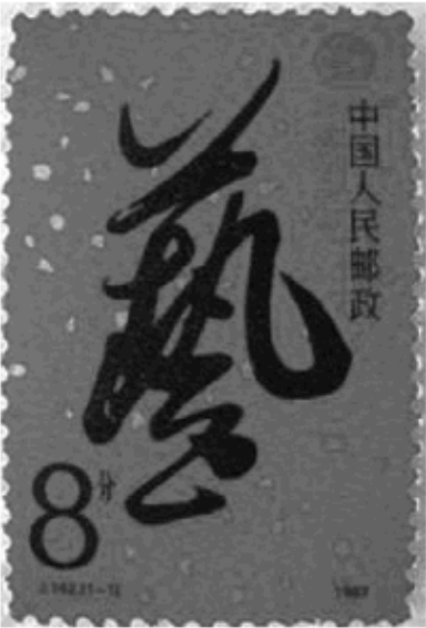
《第十届中国艺术节邮票