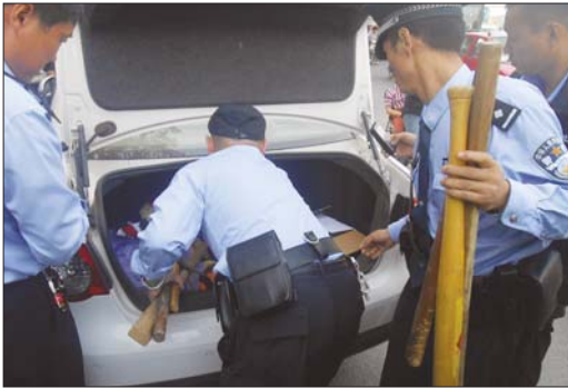
交警在车内搜出砍刀、棍棒等。

“两个人都凌空飞起,车灯等零件到处散落,他们的头盔也被甩了出去。”看着同事被撞的宁冉说,“我绝对不会让他逃走,一定要抓住他。”