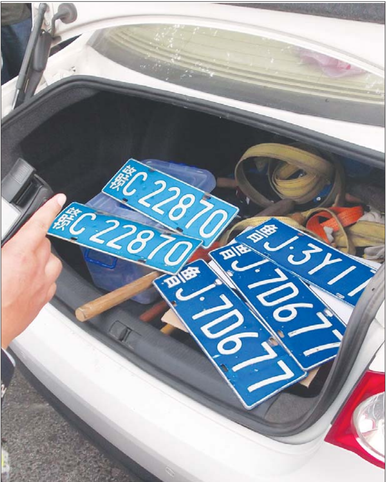
白色速腾后备箱内藏有三副牌照。