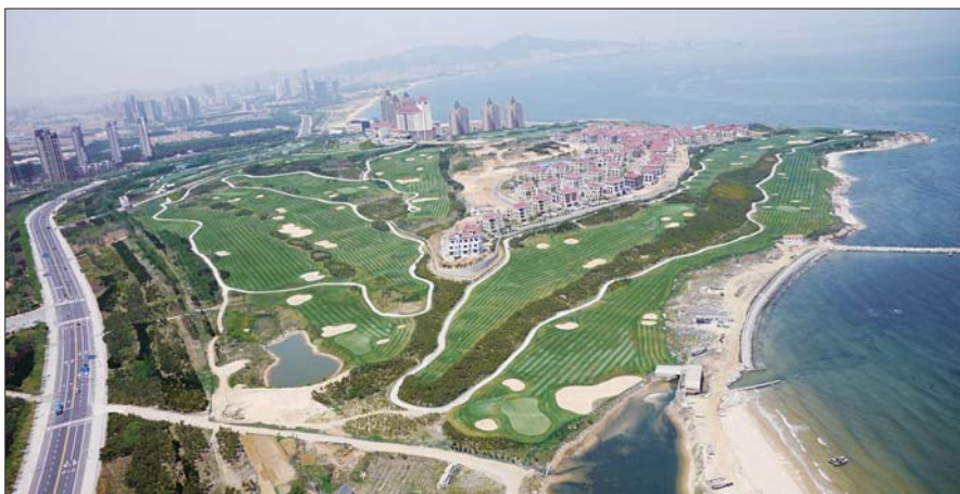
►马山寨附近一片生机。