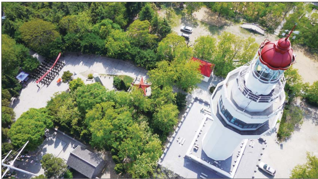
▲烟台山景区灯塔伫立。