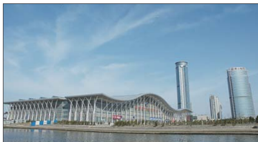
烟台市国际博览中心气势恢宏。