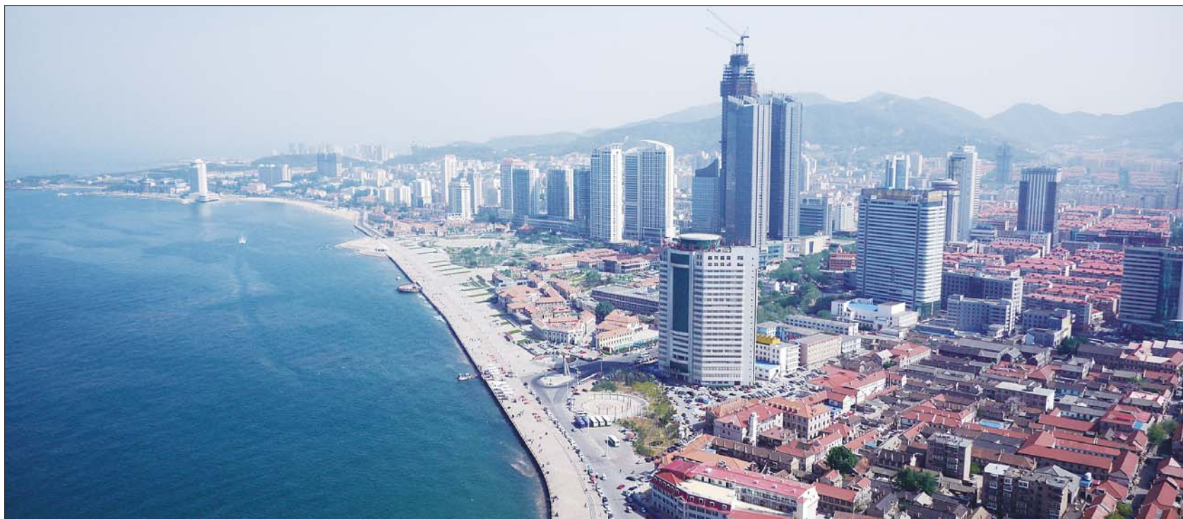
滨海广场沿线是烟台一道亮丽的风景线。