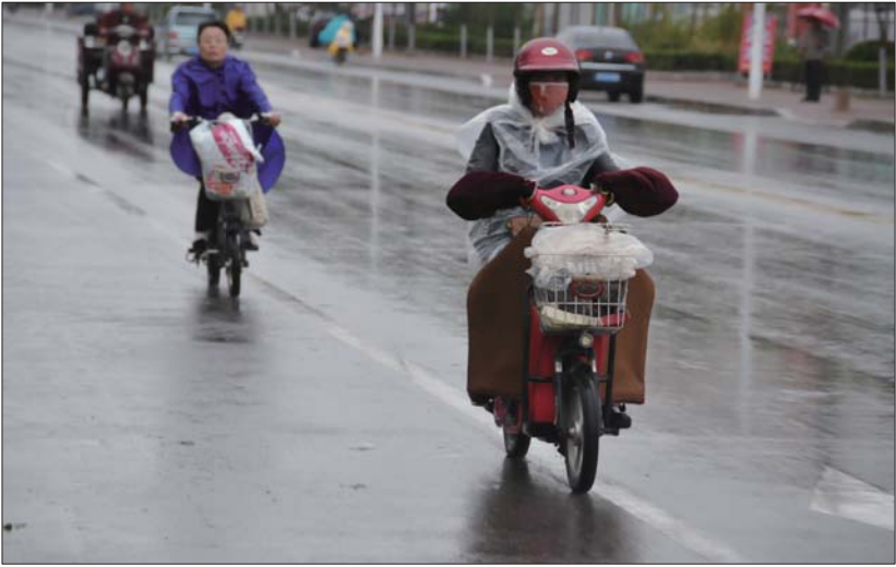
装上暖把、防风被,披上塑料布,市民在雨中穿行。

天气变化无常,前两天还在30℃左右徘徊的温度在14日一下子降到了20℃以下,最低温更是跌至5℃,较之前一天下降了10℃。滨州市气象台于14日下午3时40分继续发布寒潮蓝色预警信号:受强冷空气影响,滨州市大风降温天气将持续,14日夜间到15日白天,东北