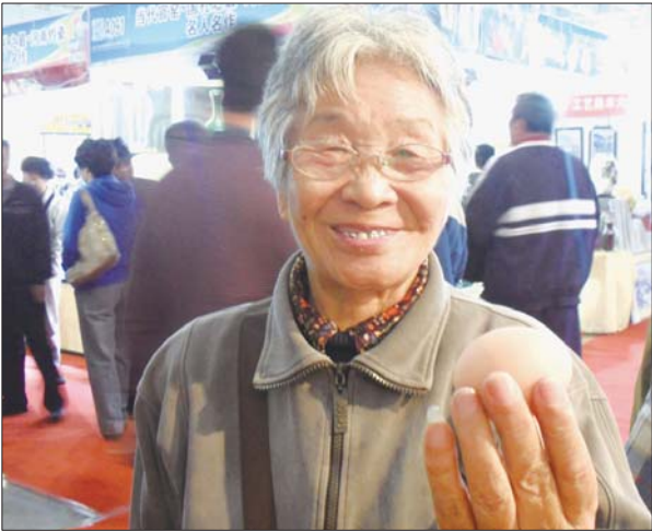
寿山石“鸡蛋”形象逼真,唐女士又喜欢又惊讶。

观展的市民看得开心,可真正出手却很仔细,福建嘉福寿山石雕工艺厂厂长林庆来告诉记者,一上午才卖了一件,不少市民都跟他说要等展会最后一天来“捡漏”。“晚来价格有优势,但不一定能选到好的。”林厂长说。