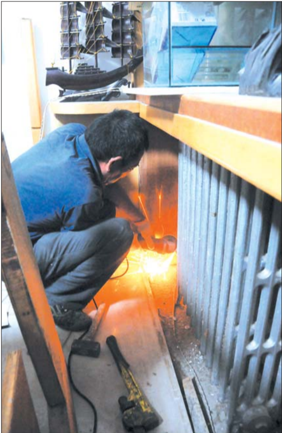
施工队正在供暖用户家中对供暖设施进行拆片改造。

昂的改造费外,她还担心家里现有的装修会被破坏,“反正家里暖气凑合也能用,就等两年再折腾吧。” 而早在2010年,住房和城乡建设部等四部委就联合下发《关于进一步推进供热计量改革工作的意见》,要求用2年时间,既有大型公共建筑全部完成供热计量改造并实行热量计价收费。 一面是政策法规强行要求进行分户改造,一面是市民对改造的各种担心。在分户改造大潮面前,不改造的后果将由谁承担? 记者获悉,按照《烟台市供热管理办法》的相关规定,居民住宅用热设施的维修,由供热单位负责;阀门、管道、散热器分别是3年、5年、10年的保质期,超期服役产生问题的均由用户承担。 此外,需要分户改造的单元楼内除非用户全数同意或不改造用户主动签署相关协议,否则供暖公司将不予以改造。