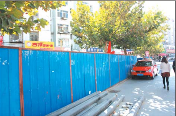
围挡建好了,却一直没有施工。

多月了,没见有人施工。 绕过围挡,记者看到,里面有6家商铺,其中1家商铺卷帘门紧锁。 在一家商铺里,顾客屈指可数。“这一个月客人少多了。”商铺老板环视完偌大的店后叹了一口气,“少赚了三成。” 究其原因,她指了指商铺门前的围挡说,并非是他的商品不行,而是围挡阻了客。 说起门前的围挡,两家饭店的老板也是眉头紧锁。 一名商户建议,在正式施工前,把围挡换成网或栅栏,让顾客能看到这里有商铺。 既然迟迟不施工,那这里为什么要竖起围挡呢? 福莱山街道办事处的一名工作人员称,目前凤台小区正在进行“美化家园”基础设施改造工程,涉及到小区全部的雨水管网、污水管网、道路以及路灯,并结合区域情况设置部分停车位。同时,对存在问题的热力管网和自来水管网也一并进行改造。