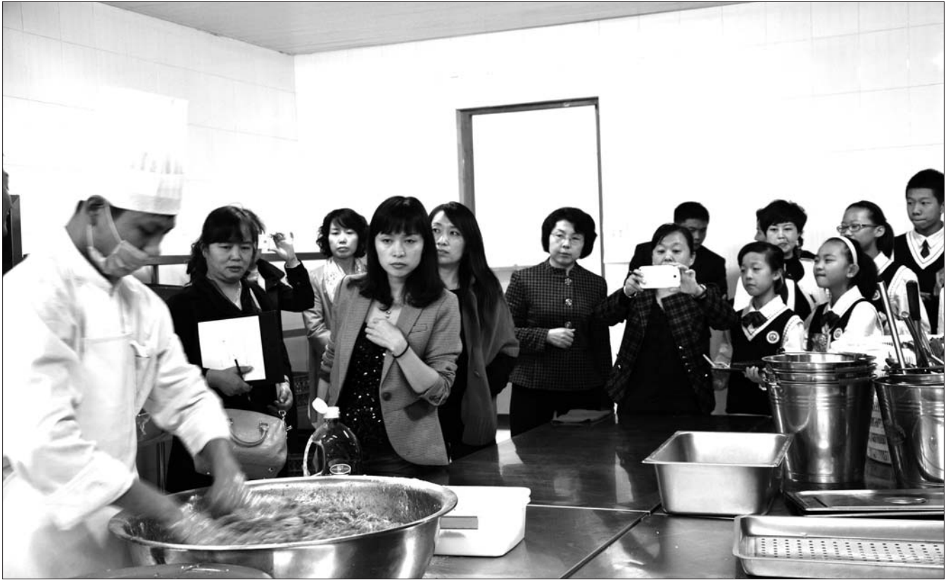
很多家长对食用油的质量很关心。本报记者 李倩 摄

本报济宁10月21日讯(记者 李倩) 18日,济宁市食品药品监督管理局举办“高新区学校食堂开放日活动”,邀请20余位家长、学校食堂负责人等参观两所学校食堂后厨,让他们现场挑毛病、找差距。