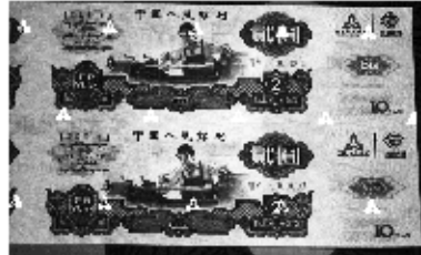
钞票防伪技术:在验钞灯下,可清晰见中国人民银行防伪水印