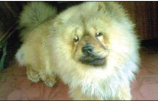
松狮“丸子”不见了,主人很着急。