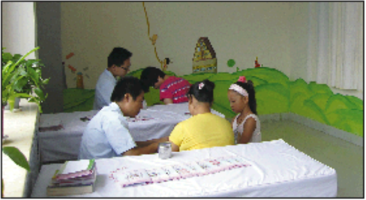
闻口分院环境干净整洁

在当地医院就诊说是需要一年的治疗时间,经过家人的介绍,来到这里就诊,三个月就能够恢复,现在过肩除颈的治疗,肿瘤已明显变小,家人感到非常满意。”像此一样,不少外地慕名而来,作为闻口分院全体医务人员则兢兢业业,为每一位来此就诊的患者和家人能散着最贴心的关怀。