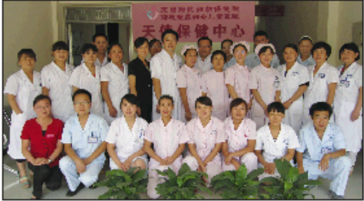
闻口分院全体工作人员