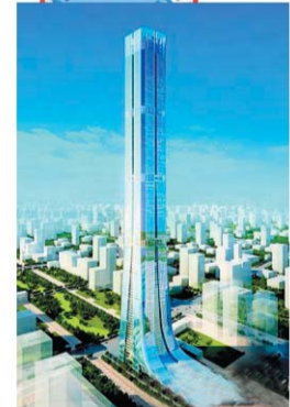
恒大国际金融中心规划图。