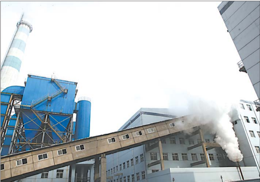
北郊热电厂的一座锅炉已经点火成功,供暖设备正在进行升温,排出蒸汽。

本报10月30日讯(记者 蒋龙龙 实习生 王雪苑) 30日凌晨,省城今冬第一座供暖锅炉在北郊热电厂成功点火。当日,北郊热电厂的发电机组也启动,并向国家电网供电。目前,锅炉产生的高温热源还待在厂内,对厂内的设施进行升温。 29日晚,隶属于济南热电的北郊热电厂一片繁忙,大量的煤炭被送进了循环流化床蒸汽锅炉,等待点燃。30日凌晨2时30分,工作人员开始通过油枪向锅炉内喷射柴油,5时,工人共喷射了近7吨柴油,将煤炭点燃,“点火过程花费两个半小时,非常顺利,今冬省城第一座锅炉成功点火。”济南热电相关负责人告诉记者。