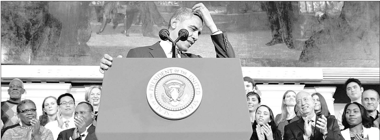
当地时间10月30日,美国总统奥巴马在波士顿发表演讲,再度为近一个月来技术故障频出的全国医保改革关键举措展开辩护,并打包票尽快修复问题。

她说,中美关系保持健康稳定发展对中美两国有利,对整个亚太地区乃至世界的和平稳定和繁荣发展也都是有利的。双方应共同努力,把不冲突不对抗、相互尊重、合作共赢这一新型大国关系的精神实质落实到两国关系的方方面面。