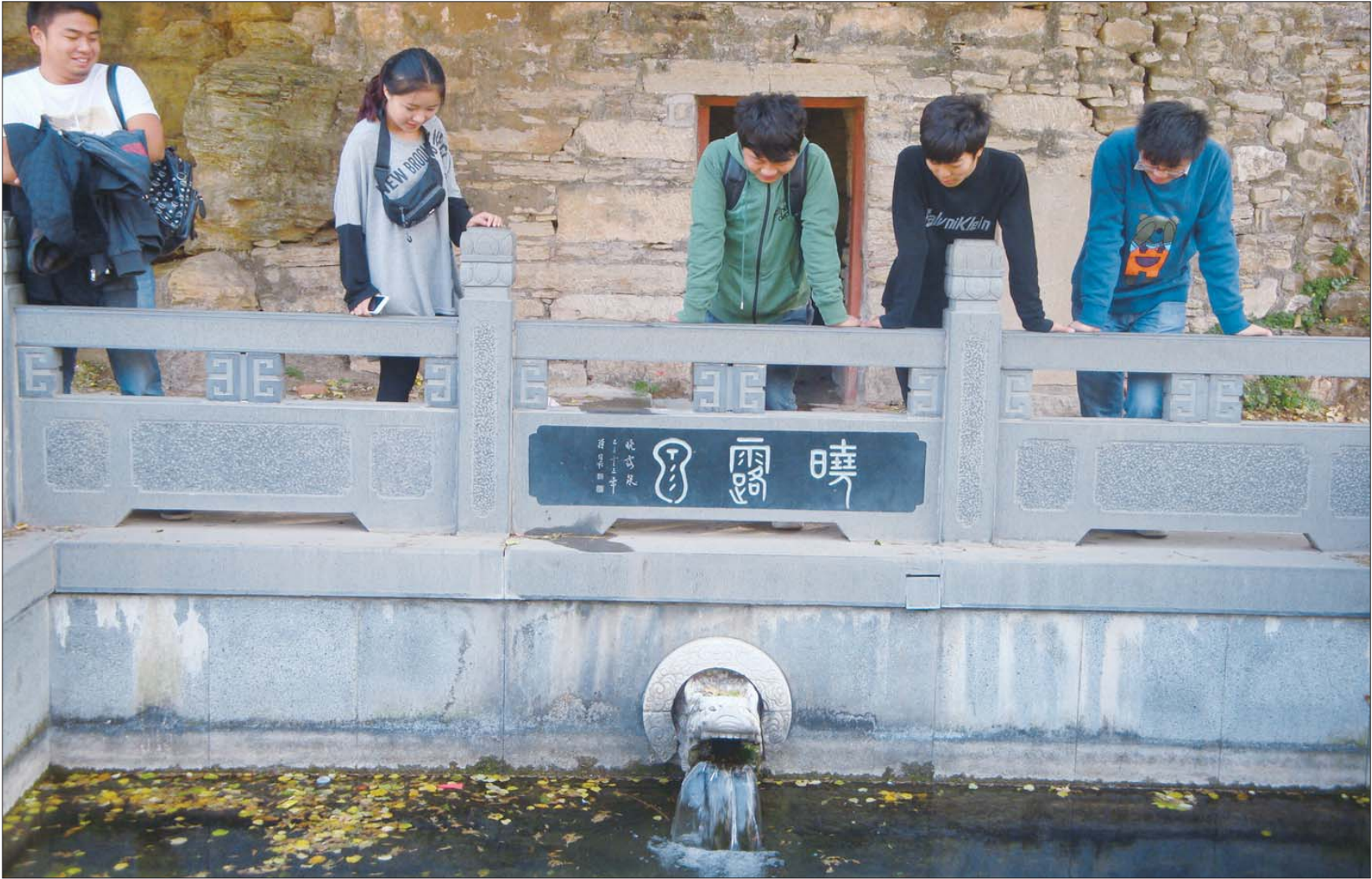
许多大学生常来此地观泉写生。