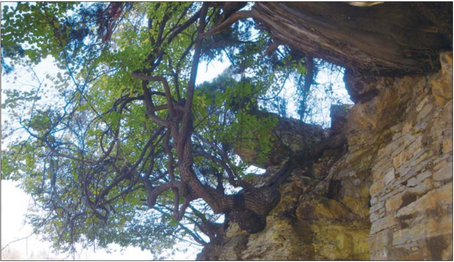
千年古柏与青藤树从岩石中长出。