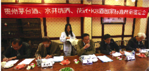
贵州茅台酒、水井坊酒、花冠·K8酒国家标准样品品鉴会