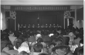
召开计划生育目标责任奖惩兑现大会