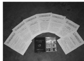
制定规范的计生文件