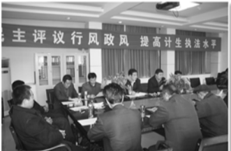
计划生育政风行风评议