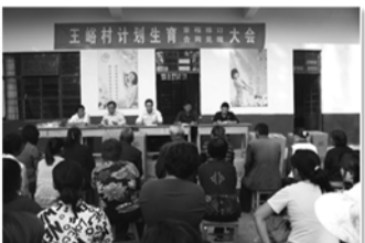
召开计划生育村民自治会议