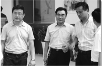
市计生协领导调研山城街道群众自治工作