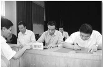
签订计划生育目标管理责任书