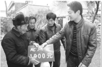
节日慰问计生困难家庭