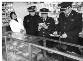
联合办公监督药物市场