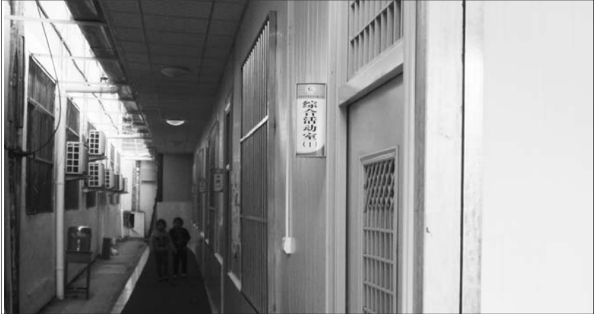
光明路小学学前班新建的板房教室。

8月末开始,市中区光明路小学修建了一些板房,并于上周开始投入使用。记者了解到,这些板房里的学生都是幼儿园的孩子。记者采访得知,学校此举也挺无奈,由于招生超标,原有的教室无法容纳所有的孩子。对此,有家长表示不理解,同样的孩子为何人家在教室上课,自己的孩子却要 go 板房读书。