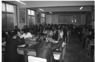
群众表决通过章程合同