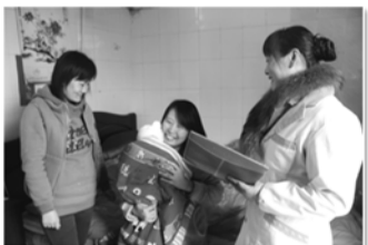
定期入户随访服务