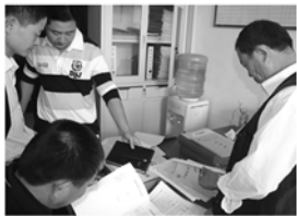
规范计生档案资料