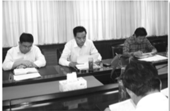
街道领导专题研究计生工作