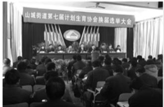
协会换届选举大会