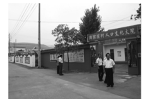
高标准新型人口文化大院