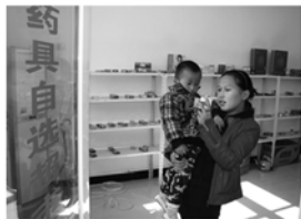
药具自选超市方便育龄群众