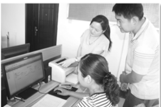
计划生育信息核查