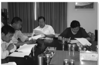
村两委干部研究分析村级计生工作情况