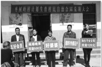
表彰计生模范家庭