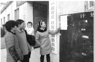
定期公示计划生育工作情况