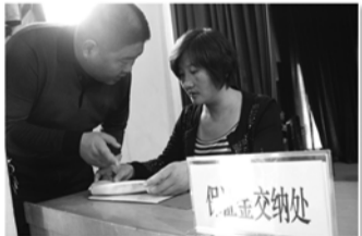
交纳计划生育工作风险金