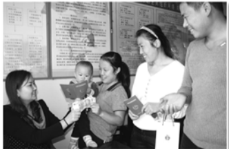
发放计生奖励扶助金