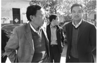
市计生委领导调研山城街道计生工作