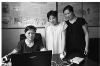
免费健康体检服务