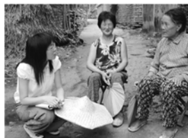
计生干部入户了解群众计生需求