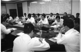
党委扩大会解决计生问题