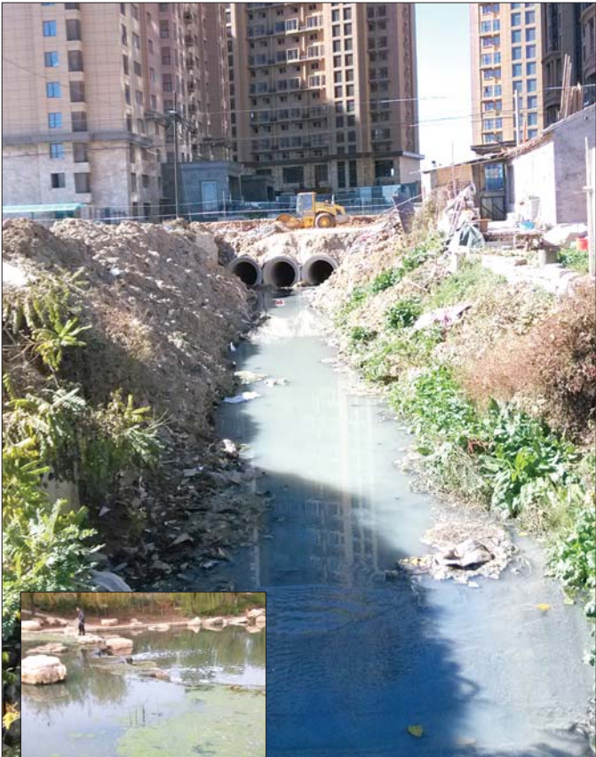
▲一条近2000米长的臭水沟延伸到龙珠路,沿途不乏其他管道往里面排水。

修的龙珠路以及地下的管网是市政工程的一部分,由莱山经济开发区管委会村镇建设中心直接负责。 “以前这边都是村子,厂子,各种农业垃圾、废水都往这个水沟里倒,然后流入逛荡河。”该管委会村镇建设中心部长张女士解释,逛荡河前面的这条臭水沟是一个老问题了,这两年逛荡河周边小区越来越多,居民生活废水增多,原来的管网已不能满足生活废水、雨水的排放。目前龙珠路、轸大路下面正在进行雨污分流工程,正是为了解决小区生活废水、雨水等排放问题。该工程争取在明年汛期前完成,届时,污水将一律通过轸大路下面的管道进入污水井,而雨水直接流到逛荡河,臭水沟将被废弃,逛荡河将会恢复清澈。