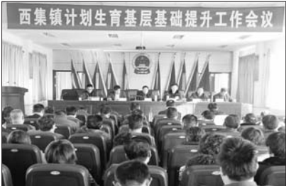
计生基层基础提升工作会议

西集镇高度重视人大工作，积极为人大工作创造良好的环境，并在人、财、物等方面优先解决。镇人大严格按照上级人大的要求，积极组织代表开展座谈、调研、视察等活动。针对《计划生育条例》和计生政策的落实情况，镇人大决定把冯庄、西集2个村作为调研视察对象，组织区、镇两级7名人大代表进行视察。代表们先后深入两个村现场察看，听取汇报，对2个村计生工作一致表示满意。首先，村两委重视，实行村两委干部包责任制，做到村支部书记亲自抓、负总责，奖惩兑现。其次，运用不同形式，深入开展“关爱女性”、“婚育新风”、“利益导向机制”等项内容的宣传，营造氛围，增强了广大群众国策意识，转变了群众的婚育观念，自觉实行计生政策。再就是舍得资金投入，多方筹措资金用于村计生服务室的改造和功能完善，夯实了基础，达到了环境优美的标准。同时突出以人为本，开展优质服务，积极为已婚育龄妇女做好各项服务，排忧解难。代表们在充分肯定2个村在执行计生政策，落实《计划生育条例》等方面取得明显成绩的同时，提出了要继续加大规范执法行为、推进村民自治、提高服务水平、努力解决制约人口计生工作发展的热点难点问题和强化各项保障措施等方面的意见和建议。