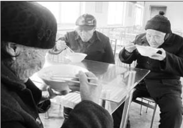
计生办鸡汤温暖孤寡残疾老人心