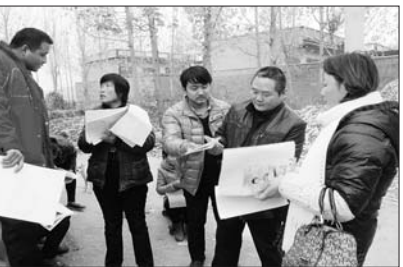
计生服务进村入户到人