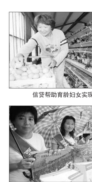
受表彰的计生模范家庭集体

为积极推行计划生育政策，号召群众树立新时期正确的生育观和致富观，帮助计生群众创业致富。该镇计生协会与农村信用联社联合推出“计生信贷助富”活动。对凡符合国家生育政策、具有创业计划的农户，有具体的创业方案和项目实施方案，且项目通过镇计生协会、经委、招商等部门联合评审的，由计生协会担保，农户出具具体相关手续，可到农联社办理2--20万不等额度的贴息贷款。该镇育龄妇女“计生信贷助富”活动，在扶持项目选择上，重点围绕扶持乡村发展特色产业，注重强化项目的支撑带动作用，与农业产业化发展相结合，放到调整农业结构和培育特色优势产业中谋划，围绕当地主导产业规划，组织引导贷款农户大力发展种植、养殖等现代设施农业、旱作农业和特色优势产业，实现创业项目、贷款资金与产业发展的有机结合。同时不断加大对贷款妇女的政策引导和技术、资金扶持力度，有效整合特色产业发