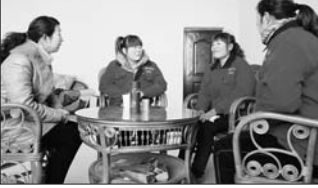
政协委员办厂帮育龄妇女就业