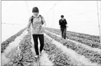
信贷扶持育龄妇女发展林果业