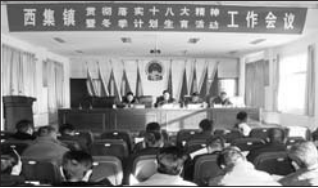
以十八大精神引领计生工作