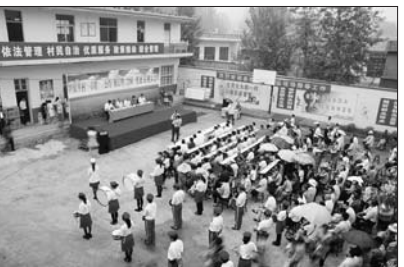
村民自治奖惩兑现大会