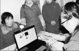
育龄妇女免费健康查体