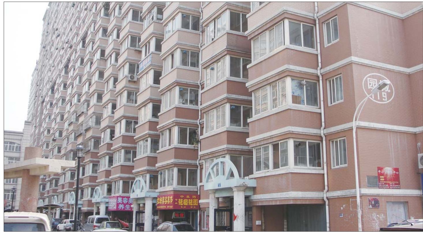
6日,记者来到新世界花园小区时,119号楼已经恢复供电。5日晚5点半到晚8点半左右,119号楼停电,全楼居民只好摸黑。