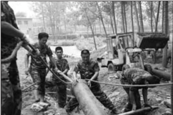
第二水源地施工现场