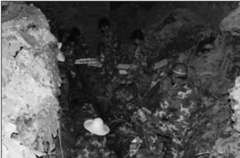
工程技术人员加班加点排险除障