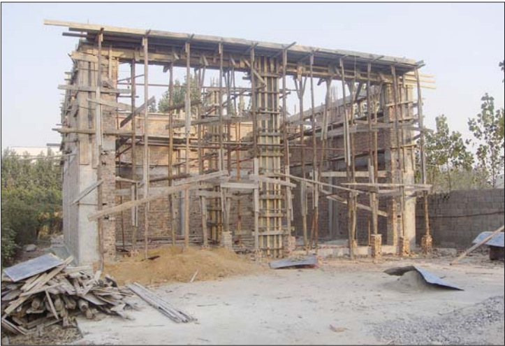
建设中的张汪镇第二座垃圾压缩中转站。

记者了解到,各垃圾中转站建设时将同步完善给水、供电、排污工程,配建公厕和管理房,配备大型压缩车、小型勾臂车、收集容器等设施,相关费用由滕州市、镇两级财政承担。