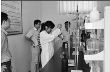
化验员现场进行水质检测