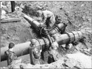
工程技术人员冒雨检修供水管道