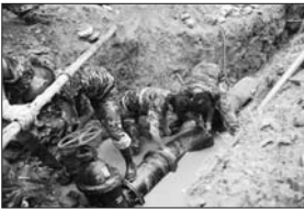
供水管道安装现场

不积跬步无以至千里,不积小河无以成江流。为城镇居民、商业、企事业单位提供优质高效的供水服务是我们对用户最好的承诺,公司将长期坚持下去,努力做一个有社会责任感供水企业,为山亭地区经济的快速发展,保障居民生活安全用水作不懈的努力。