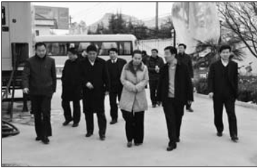
区委副书记、区长李春英视察双山水厂运行情况

连续多年保持“省级价格诚信单位”、“省级消费者满意单位”、“省城镇供水先进集体”、“省级信誉建设定点示范单位”、“市级青年文明号”等荣誉称号的基础上,2013年初先后被授予“枣庄市价格诚信示范单位”、“全市价格管理工作”先进单位”荣誉称号。