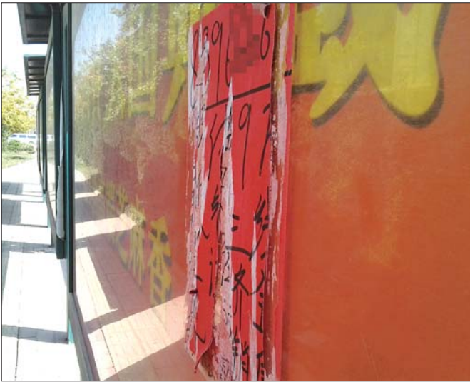
天辰路边不时可见野广告。