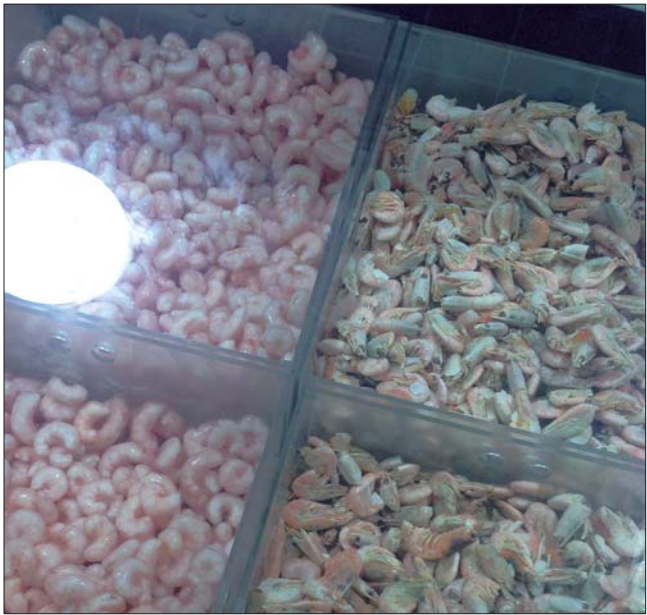
被冰衣包裹的冻虾和虾仁

记者随后以顾客的身份询问了莱城区南外环一家海鲜销售店的老板，这位陈姓老板对记者说：“现在多数海产品都带着冰块，我们称重时也是带冰称的，你要是觉得不划算也可以买鲜虾，不过价格要高上不止两倍。”