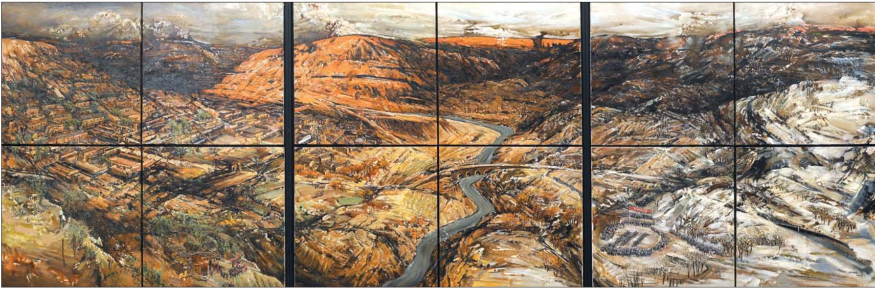
▲《四季岁月——山东抗日根据地建设》 仲济昆