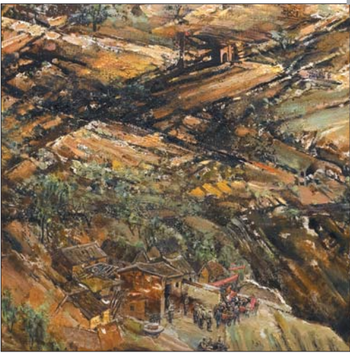
▲《四季岁月——山东抗日根据地建设》局部之二

山东省油画学会理事,山东省美术家协会油画艺术委员会特邀委员,山东画院高级画师,山东师范大学硕士研究生导师。作品多次参加国内外重要展览并多次获奖。在历次山东省美展获得多个一等奖。在北京、上海等多次举办仲济昆油画个展。几年中在《中国油画》,刊发三十余幅作品及相关评论文章。 2008年7月作品参加在德国举办的“中国风·德国邀请展——全球化语境中的中国抽象艺术”;2008年作品《荷塘》、《黄土高坡》、《吕梁磧口》、《摄塬四季》入选《2008中国美术年刊》;2009年作品《山水》、《秋玉米》、《蒙山风景》、《四季杨家沟》入编《2009中国当代艺术年鉴》;2011年2月仲济昆16幅油画作品参展由中国驻意大利使领馆、意中文化交流协会、《欧洲华人报》社、凤凰卫视、欧洲华夏集团等联合主办的“意大利文化交流年中国油画名家画展”活动·意大利(米兰·佛罗伦萨·威尼斯·罗马巡回展)。 出版:2007年5月出版《中国当代油画家·仲济昆》(山东美术出版社),2008年10月出版《油画家·仲济昆》(山东美术出版社),2010年2月出版《仲济昆油画》(山东文化音像出版社)。