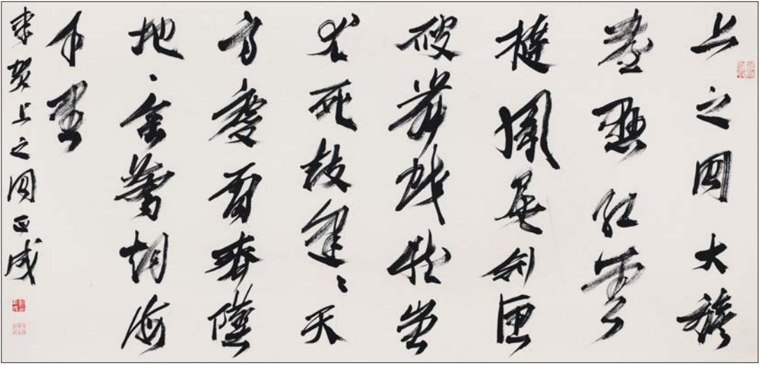
▲李贺上之回行草横幅 纸本 69cm×138cm