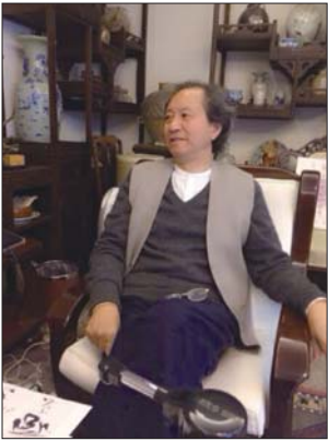
刘正成 别署:听涛斋主、八方斋主、松竹梅花堂主、二味

石榴堂、泥龟梦蝶堂、载天山人等。一九四六年八月生于四川成都,编审。曾任大型文学丛刊《人世间》副主编,中国书法家协会副秘书长,中国书协学术委员会副主任,《中国书法》杂志社社长、主编。现为国际书法家协会主席、《中国书法全集》主编,九三学社中央文化工作委员会委员;北京大学、清华大学、暨南大学、南方科技大学、兰州大学、中央美术学院、河北美术学院等客座教授。 一九九二年起享受国务院特殊津贴。一九九八年荣获韩国美术家协会和韩国美术文化院颁发的“世界书法功劳牌”;二〇〇〇年选任国家文化界五十