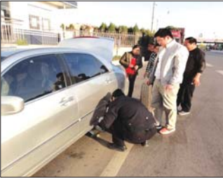
民警协助帮忙换上轮胎。

本报泰安11月20日讯(记者 曹剑 通讯员 马世亮) 驾驶经验不足,男子开着轮胎漏气的车在高速路上呼呼跑,幸好交警眼尖发现并拦下。 19日下午4时,高速交警大队巡逻民警巡逻至泰肥收费站出站口时,发现前方一辆行驶的小轿车左右晃动,车身颤抖很厉害。经过仔细查看,该车右后胎跑气发瘪,驾驶人确浑然不知依旧行驶。巡逻民警随即用车载喊话器让驾驶人减速停到前方警务室。 司机一下车有些不知所措,民警随让其检查车况,司机检查一圈看到变半气的右后车胎恍然大悟。经询问得知,司机从泰安回肥城,由于驾车经验不足,不知道什么时候车轮胎漏气,只是感觉有些跑偏。 民警随即协助其换上备胎,并嘱咐其以后开车要注意车辆情况,临行时司机握着民警的手说谢谢。