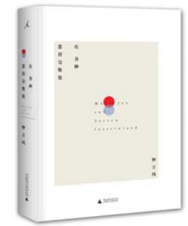
《在各种悲喜交集处》 钟立风 著 广西师范大学出版社