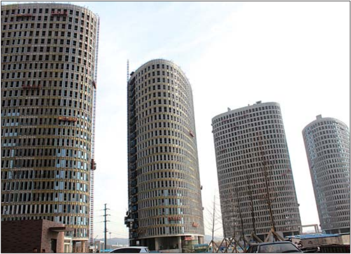
配套建设的商用医药企业办公楼宇。

实现企业入驻,届时将成为我省未来新药研发的核心载体。”项目负责人介绍。除了引进外来的生物医药项目,基地孵化也是高新区发展生物医药的一项重要方式。据了解,目前高新区的中心区聚集了400多家生物医药企业,其中有不少是通过孵化方式发展起来的,未来国家创新药物孵化基地将重点集聚国内外优势名牌,知名企业、研发机构和集团总部。