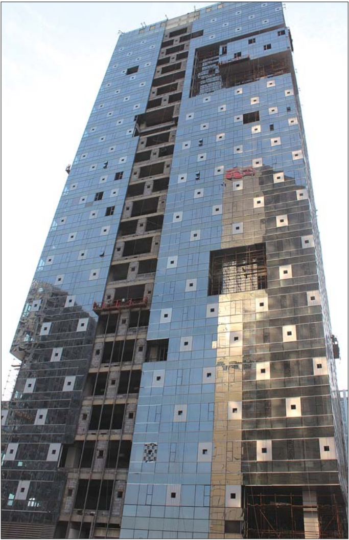
在建中的用于医疗器械、诊断试剂中试科研办公楼。

虹”生产中试楼和医药车间,“生命彩虹”生产中试楼用于量产企业设立实验室进行就地检测分析实验,医药车间全部按照GMP标准建设厂房,可以满足医药企业“拎包入住”,迅速开展中试和产业化业务;产业园同时配套OEM基地和公共药厂,可以就地完成医药生产相关的离岸医药服务外包和代工生产服务。