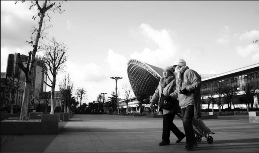
28日,烟台能见度高,火车站上空湛蓝通透。

据环保专家介绍,这几天空气质量好,主要与天气有关,降雨和小雪降下了空气中的一些浮尘,另外大风天气加速了污染物的扩散。