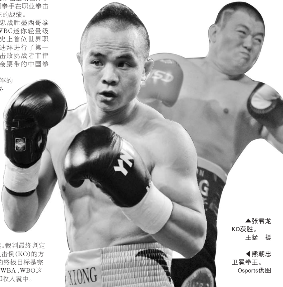
▲张君龙KO获胜。 ▼熊朝忠卫冕拳王。

本报讯 11月30日,熊朝忠在家乡云南文山州马关县,用KO的方式完成了自己职业拳击的第二场卫冕战,蝉联WBC迷你轻量级世界拳王金腰带,同时也完成了中国拳手在职业拳击历史上首次本土卫冕世界拳王的战绩。 去年的11月24日,熊朝忠战胜墨西哥拳王哈维尔·马丁内斯,加冕WBC迷你轻量级世界拳王金腰带,成为中国史上首位世界职业拳王。今年6月,熊朝忠在迪拜进行了第一次卫冕,打满12个回合点数击败挑战者菲律宾的奎洛,成为第一位卫冕金腰带的中国拳王。 比赛开始,熊朝忠卫冕冠军的霸气在开局阶段表现得淋漓尽致。熊朝忠虽然身高臂展不占优势,但是力量、抗击打以及速度上都超过对手。首回合,熊朝忠的连续进攻给对手带来不小的压力,进攻的势头非常凶猛。 第二回合,熊朝忠的进攻越发凶猛,多番把对手逼到围绳边连续进攻,不断掀起现场高潮。如果说熊朝忠以往在迷你轻量级是以力量和抗击打突出见长,那么本回合熊朝忠在组合拳、连续进攻能力上表现得更加出色。 在第五回合,熊朝忠在拳台上两次击倒对手,最后一次下勾拳直接重重击中对手肋部,导致对手倒地不起。裁判最终判定对手无法继续比赛,熊朝忠以击倒(KO)的方式获胜。熊朝忠还是表示,他的终极目标是完成世界统一战,争取把WBC、WBA、WBO这些世界拳击组织的金腰带全部收入囊中。