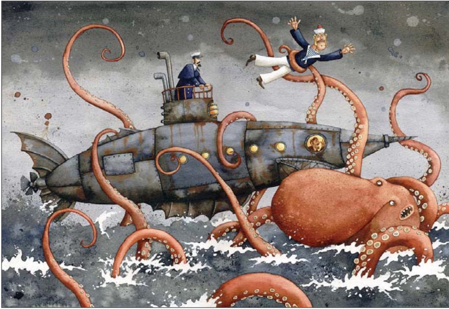
科技的进步有多快，人类的想象力就能够延伸多远。