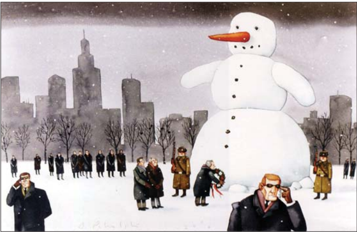
今天不可一世的“大人物”，也许明天只是阳光下的一摊污水。