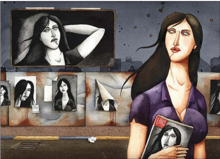
旧日的时光显得弥足珍贵，是因为它们不会再来。