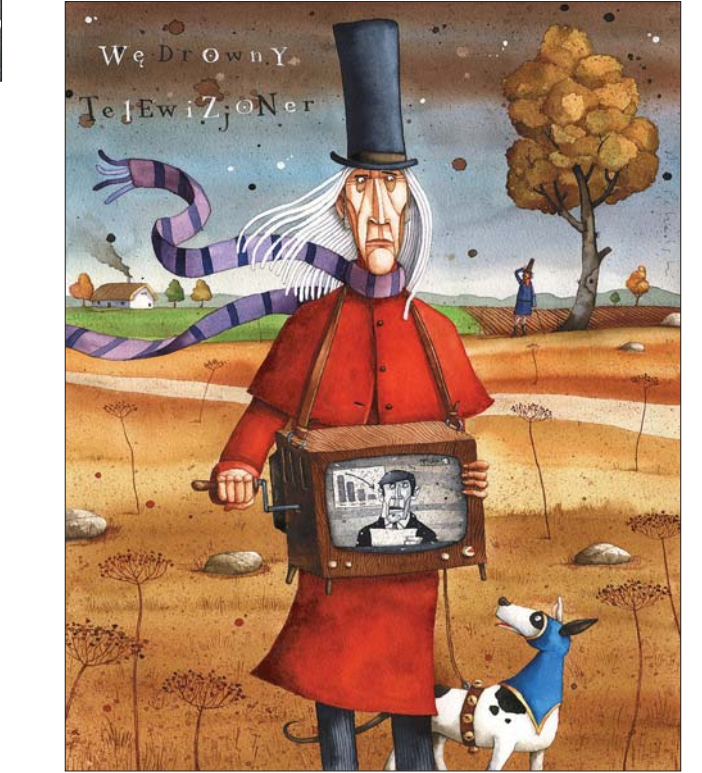
默默无闻却生趣盎然与名声显赫却枯燥乏味，你会选择哪一个？

亚当·佩卡斯基是出生于波兰的德国裔艺术家，他出生于1975年，1995年至2000年分别在波兰的斯图卡学院和德国的波恩大学学习版画和插图艺术。毕业后成为普拉科尼学院的艺术教授，同时受聘为捷克布拉格大学图米列维卡学院客座教授。佩卡斯基的艺术风格细腻，造型写实，内涵丰富，有些接近国人所称的绘本插画，在欧洲享有很高的声誉，曾应邀在波兰、德国、法国、瑞典、英国、捷克和俄罗斯举办个人艺术展。同时在欧洲多家艺术和漫画展赛上获得多项大奖，包括素以前卫著称的波兰列格尼卡国际讽刺艺术节大奖。