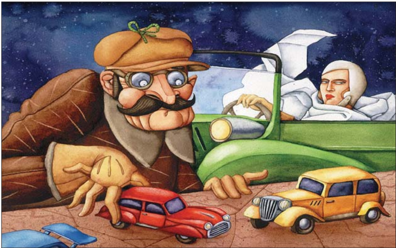
外面世界光怪陆离的诱惑面前，我们是否还会想起自己渐行渐远的精神乐土？