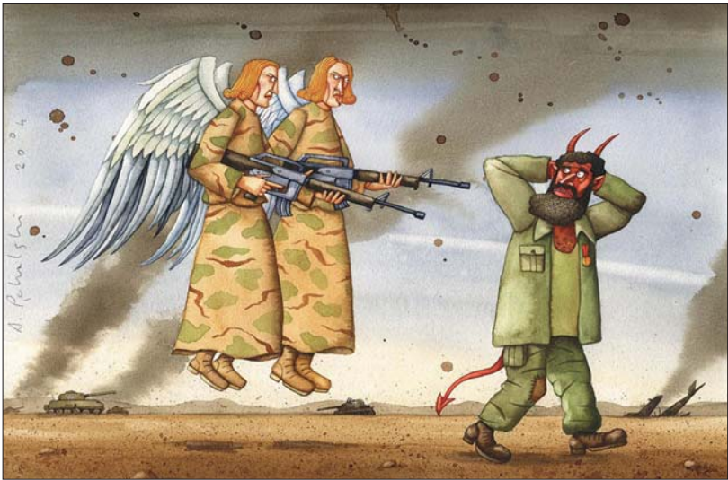
以暴抗暴，冤冤相报何时了？