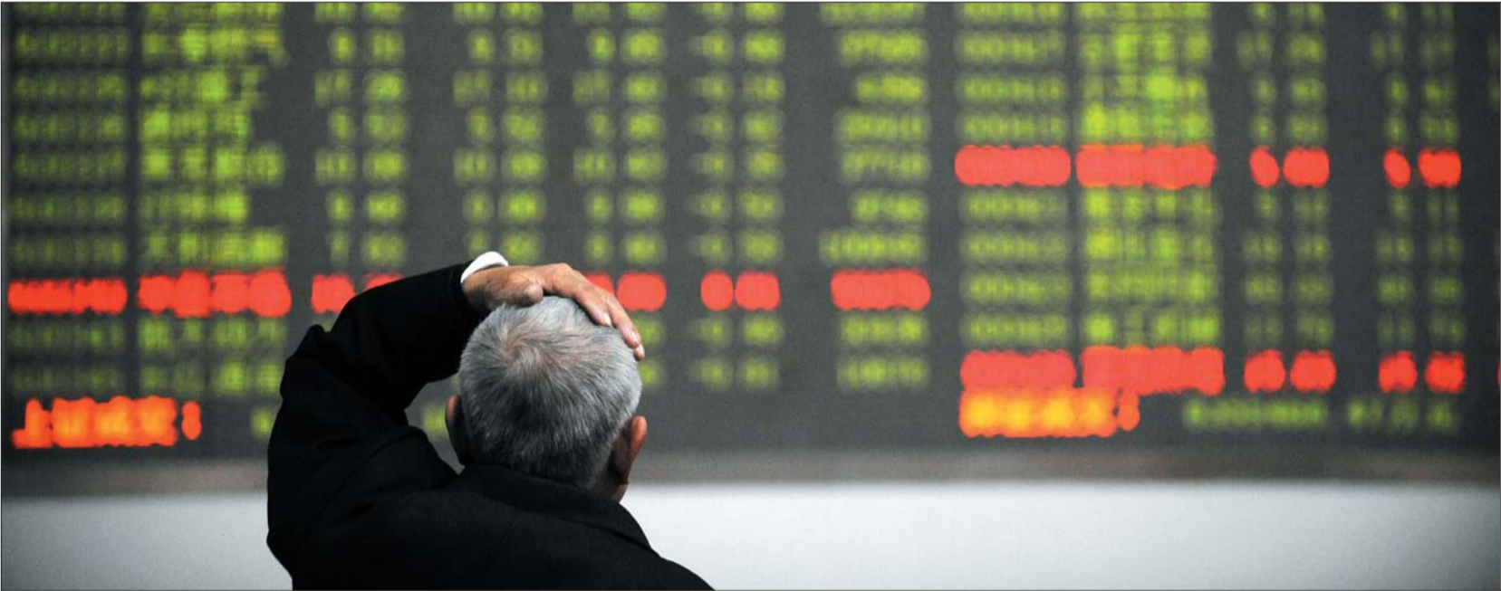
▲ IPO 重启的消息披露后,股市一度大跌。(资料片) 左庆 摄