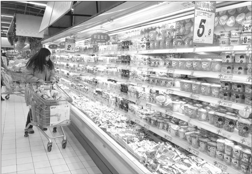
超市各品牌牛奶纷纷涨价，图为一市民正在选购。

“我才几天没来，这一箱奶涨了十来块钱。”4日中午，在省城大润发超市，一买牛奶的市民看着标价牌感叹，孩子一直在喝的蒙牛未来星系列牛奶，原来一箱只要48块钱，现在一下子涨到了60块钱。“孩子一天一盒，一个月得喝两三箱，这就得多花二三十块钱。”除了蒙牛旗下产品，各个超市中伊利、光明、三元等品牌的奶品价格也都有所提升。各品牌销量最大的包装种类最为常见的百利包袋装牛奶大都是价格最低的产品，像三元纯牛奶原价在1.8元，现在的价格涨至2.2元。而像佳宝这种受市民喜爱的当地品牌，价格也有所上涨。 “不是哪个牌子的事，基本上都涨价了。”省城家乐福超市蒙牛乳企的一名促销人员告诉记者，涨价从11月末陆续就开始了，现在她最主要的工作就是接涨价通知，换价格标签。“以前，百利包的包装很少上两块钱，你看现在，一块多钱的基本没了。” 记者在多家超市寻找发现，除了部分品牌产品有优惠活动之外，大部分百利包牛奶价格都在2元以上。“各品牌各系列产品涨价幅度不一样，大约整体涨价幅度在一成左右。”大润发超市一经理告诉记者。 “我们家每天早饭都喝牛奶，这价格一涨感觉很明显。”一位正在大润发超市选购的女士说，现在喝牛奶都成了高贵生活的象征了，“看看吧，要是觉得不划算买个豆浆机以后喝豆浆算了。”