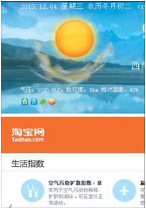
腾讯天气4日16时数据