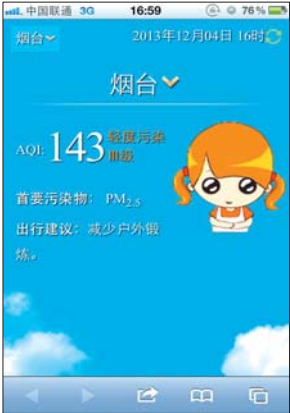
环保部门官方4日16时数据