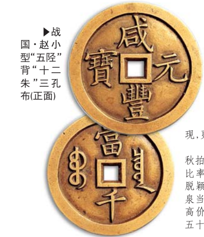
►战国·赵小型“五铢”背“十二朱”三孔布(正面)