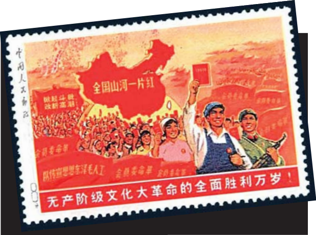
▲嘉德春拍“全国山河一片红”拍出730.25万元。