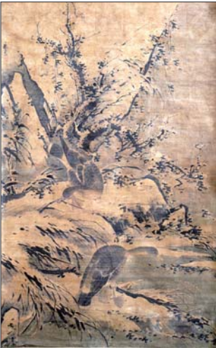
明林良的《芦雪双雁图》纵193.5厘米，横119.6厘米。为国家一级文物。

林良(1436-1487)，字以善。广东南海人。活跃于明正统至弘治年间，因善画而入官，任锦衣卫指挥、镇抚，值仁智殿。林良最擅花鸟。此画为林良的代表作。绢本，设色。写大雁栖迟雪塘芦丛的图景。画中崖石积雪，枝叶纷披，芦苇倒伏，一派萧索冷寂的气氛。一雁伸颈凝视水面，欲觅鱼虾，又踟躇不前，似惧于冰水之寒。另一雁俯啄枯萎的芦叶，显出饥不择食的情态。图中大雁用笔工致，墨晕精妙，淡染赭色，衬景笔墨则健劲率意，迅疾飞动，如作草书。画作左上角以行楷署“林良”款，款下钐一朱文篆书印“以善图书”。画轴题签由我国著名书法家费新我所书：“明林良双雁图轴丁卯立秋节费新我署”，下钐一朱文篆书印章“新我左腕”。