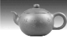
圆珠壶 原矿底槽清泥料