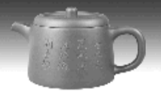
晓瓦壶 “鹿耳红”泥料