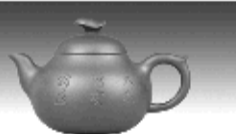
天鸡壶 “鹿耳红”泥料