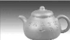
梅兰壶 黄泥山清水泥