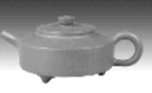
乳鼎壶 黄泥山清水泥