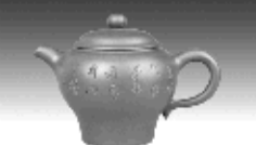
古直壶 “鹿耳红”泥料