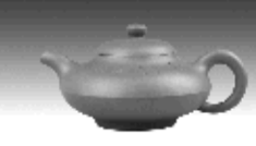
合欢壶 黄泥山清水泥