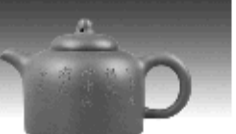
百衲壶 原矿底槽清泥料