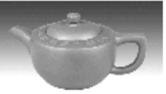
梅兰壶 原矿底槽清泥料