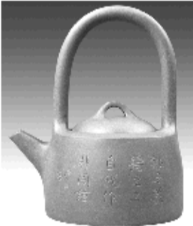
石瓢壶 黄泥山清水泥

【价格调整公告：“曼生十八式传世壶王”自问世以来，受到广大紫砂爱好者的热烈追捧，目前仅剩六套，于今晚12点整，价格将从19800元调整到22800元，还没有来得及收藏的朋友致电0531-83182668 83182778切勿错过最后机会！