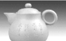
快红壶 黄泥山清水泥