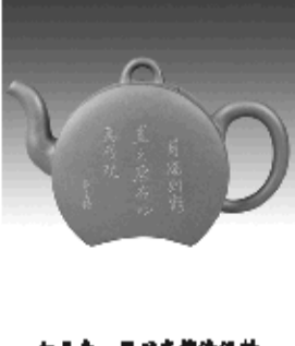
荷叶壶 原矿底槽清泥料