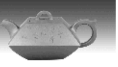
合欢壶 “鹿耳红”泥料