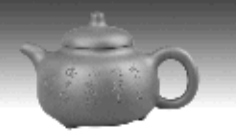
横云壶 原矿底槽清泥料