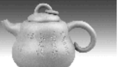
葫芦壶 黄泥山清水泥