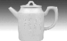
古直壶 黄泥山清水泥